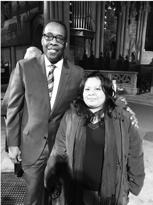
Carmela y el presidente del Concejo Municipal Darrell Clarke