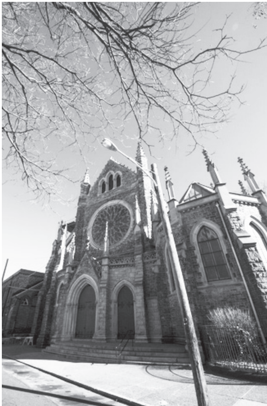
Vista actual de la Iglesia del Advocate